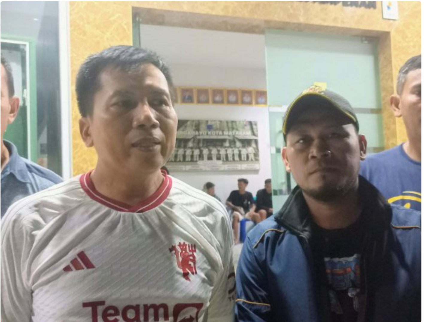
Kapolsek Ampenan didampingi Danramil, Camat Ampenan serta Lurah Ampenan timur.

Mataram NTB - Respon cepat Polsek Ampenan, Koramil Ampenan dan Pemerintah Kecamatan Ampenan mengambil langkah antisipasi terhadap kesalahpahaman yang terjadi antara kelompok pemuda warga lingkungan